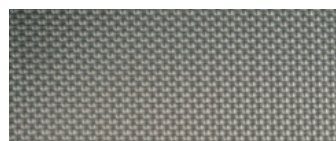
extérieur inox gaufré