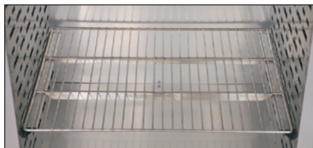
3 plateau renforcé en acier inox