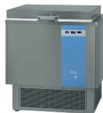
2 congélateurs coffre 55 litres