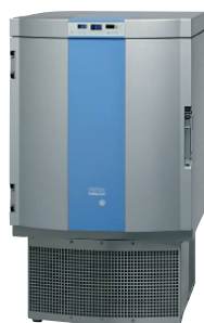
1 congélateurs verticaux 100 litres