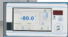
nouveau régulateur à écran tactile couleur