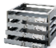
3 rack à tiroirs pour boîtes cryogéniques