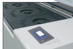
panneau de commande