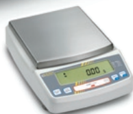
type B plateau 180 x 170 mm