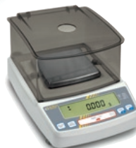
type A plateau 108 x 105 mm